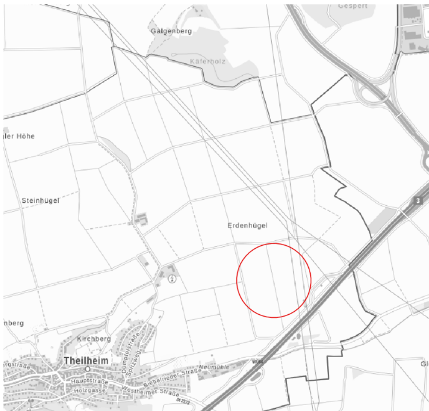
Abb. Übersicht Lage des Vorhabens nicht maßstäblich

Der Geltungsbereich liegt nordöstlich von Theilheim (Landkreis Würzburg, Regierungsbezirk Unterfranken).