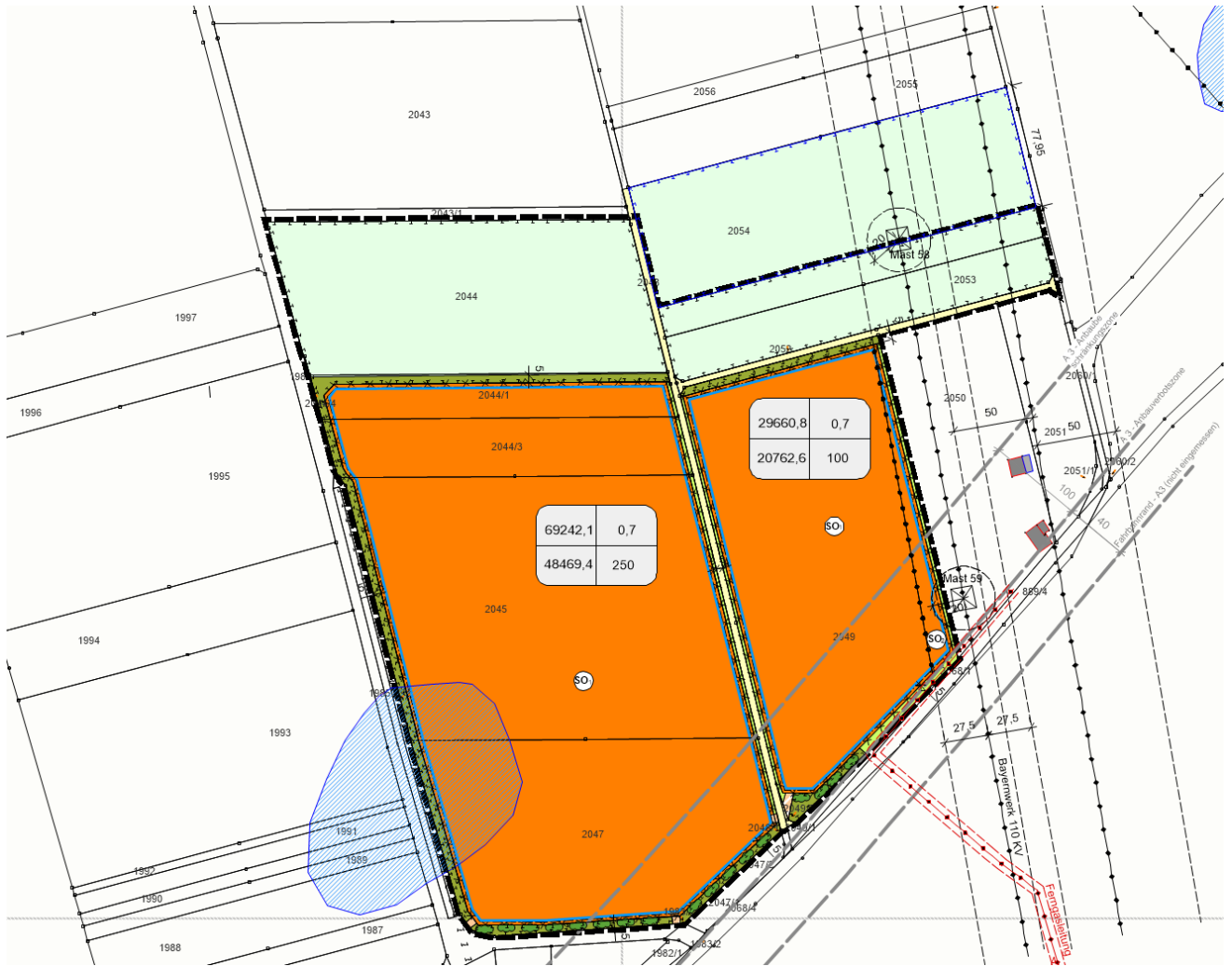
Abb. Geltungsbereich des Vorhabens (Ausschnitt BP ohne Maßstab)

Der Geltungsbereich des Bebauungsplans mit Grünordnungsplan enthält interne Ausgleichsflächen, für den naturschutzfachlichen und artenschutzrechtlichen Ausgleich. Weitere für den Artenschutz erforderliche Ausgleichsflächen grenzen benachbart zum Geltungsbereich an.