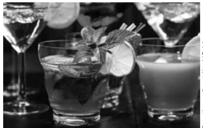
Alkoholfreie Cocktails können optisch und geschmacklich locker mit alkoholischen Getränken mithalten – ohne deren „Nebenwirkungen“.

www.aok.de/pk/magazin/wohlbefinden/motivation/feiern-ohne-alkohol/